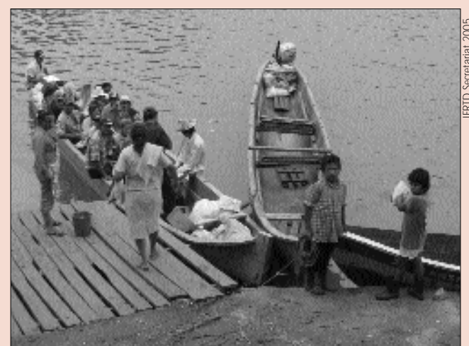
Los embarcaderos espontáneos sirven a las necesidades de las comunidades locales en Nicaragua, los investigadores de Vigilar la Agenda de Pobreza en América Latina identificaron una falta de interés en las vías acuáticas

La primera fase del programa Vigilar la Agenda de Pobreza se puso en marcha en 14 países de América Latina, Asia y África: Nicaragua, Perú, Bolivia, Indonesia, Camboya, Sri Lanka, Nepal, Kenia, Tanzania, Uganda, Zimbabwe, Burkina Faso, RD Congo y Senegal. En estos países los participantes en el programa han logrado llevar a cabo estudios de cómo y si las políticas y estrategias nacionales de transporte existentes se interrelacionan con los